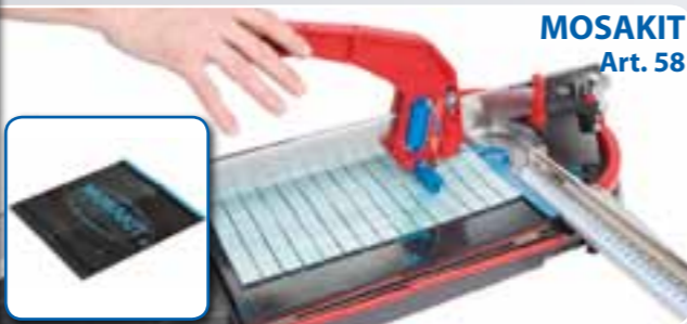
MOSAKIT Art. 58