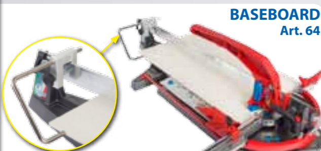
BASEBOARD Art. 64