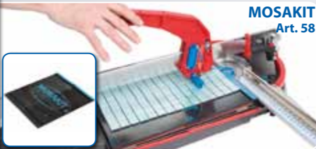
MOSAKIT Art. 58