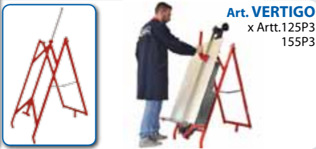
Art. VERTIGO x Artt.125P3 155P3

GARANZIA - Tutte le tagliapiastrelle manuali MONTOLIT sono coperte da garanzia a vita (riconosciuta a giudizio esclusivo dell'Ufficio Tecnico della Brevetti MONTOLIT S.p.A.) su eventuali difetti di costruzione. Guasti derivanti da un uso non conforme o da normale usura sono esclusi dalla presente garanzia.