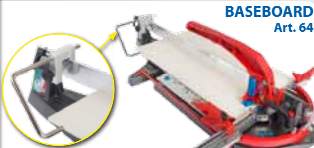
BASEBOARD Art. 64