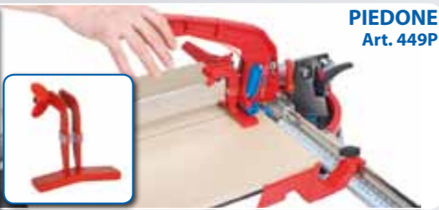
PIEDONE Art. 449P

ACCESSORI • ACCESSORIES • ACCESSORI • ACCESSORIES • ACCESSORI • ACCESSORIES • ACCESSORI • ACCESSORIES • ACCESSORI • ACCESSORIES