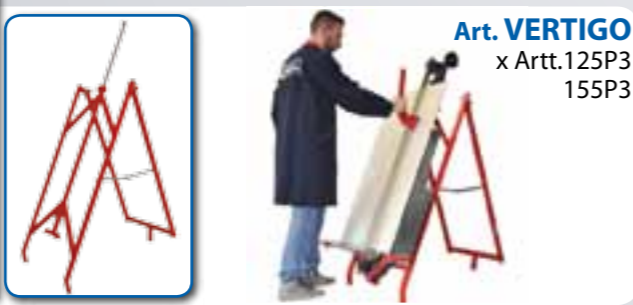
Art. VERTIGO x Artt.125P3 155P3

GARANZIA - Tutte le tagliapiastrelle manuali MONTOLIT sono coperte da garanzia a vita (riconosciuta a giudizio esclusivo dell'Ufficio Tecnico della Brevetti MONTOLIT S.p.A.) su eventuali difetti di costruzione. Guasti derivanti da un uso non conforme o da normale usura sono esclusi dalla presente garanzia.