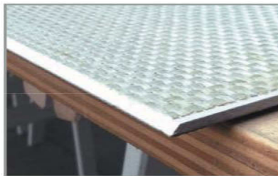
JOLLY su una lastra di 3 mm. JOLLY on a 3mm tile.