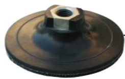
Platorello con velcro. Pad with velcro.

Adjustable to any angle from 22° to 90°.