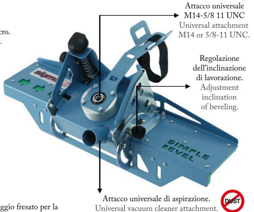
Attacco universale M14-5/8 11 UNC Universal attachment M14 or 5/8-11 UNC.