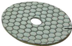
Mola diamantata. Diamond grinding wheel.