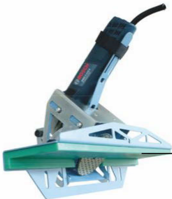
Piano d'appoggio fresato per la massima precisione, in materiale Anti-frizione. Sliding surface milled for the maximum precision, in Anti-friction material.